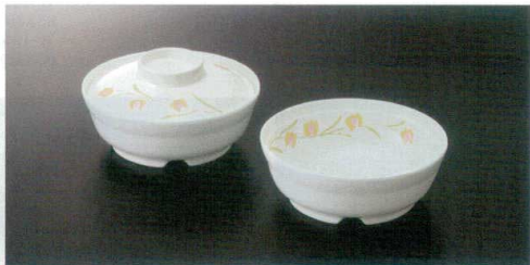
GER-414 煮物碗(身) T-3 135×48 69 450cc ¥1,270 GER-415 煮物碗(蓋) 127×28 ¥830