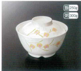
GER-221 飯井(身) T-3 141×74 98 650cc ¥1,240 GER-222 飯井(蓋) 128×37 ¥760