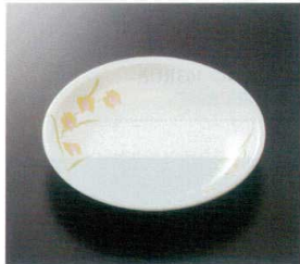
GER-477 16.5cm丸皿 T-3 165×29 ¥1,070 P-203 ¥470 63 揚 172頁