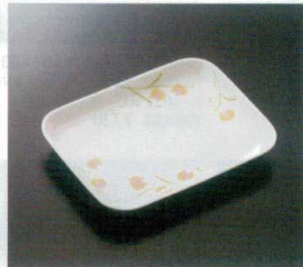
GER-407 角皿 T-3 165×125×21 ¥1,180 299-OP ¥460 61 揚 176頁