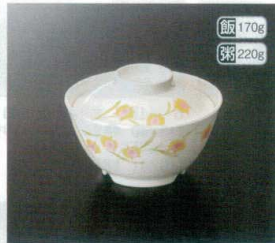
GER-225 飯井(身) T-3 125×65 85 450cc ¥1,070 GER-226 飯井(蓋) 113×31 ¥700