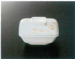
G-417I 角煮物碗(身)(アイボリー) T-3 130×130×45 73 400cc ¥1,120 GER-418 角煮物碗(蓋) 126×126×32 ¥1,030