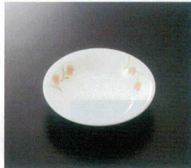
GER-116 13cm深皿 T-4 130×30 180cc ¥770 306-OP ¥420 74 揚 173頁