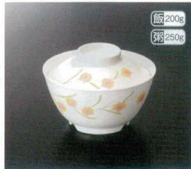
GER-223 飯井(身) T-3 130×69 91 500cc ¥1,150 GER-224 飯井(蓋) 117×34 ¥700