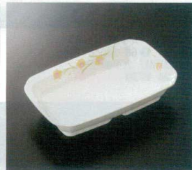
GER-401 角皿 T-3 184×117×37 350cc ¥1,530 305-OP ¥460 68 揚 176頁