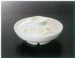
G-3171 煮物碗(身)(アイボリー) T-3 162×47 74 490cc ¥1,460 GER-114 蓋 150×39 ¥780