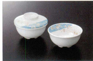
GH-467 丸小鉢(身) 124 110×50 76 280cc ¥970 GH-467F 丸小鉢(蓋) 110×31 ¥810