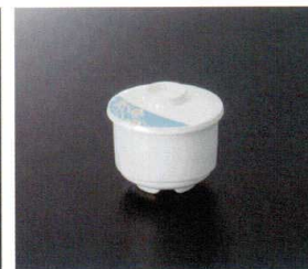
G-461I むし茶碗(身)(アイボリー) 123 76×60 73 180cc ¥730 GH-61F むし茶碗(蓋) 84×18 ¥490