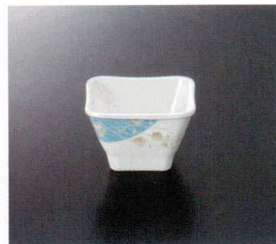
GH-305 小付 85×85×55 180cc ¥990