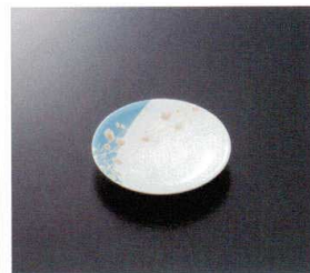
GH-453 小皿 100×18 ¥520