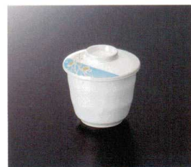
G-146I むし茶碗(身)(アイボリー) 122 81×72 87 220cc ¥550 GH-146F むし茶碗(蓋) 90×20 ¥400