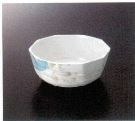
GH-165 十角小鉢 121 126×52 420cc ¥1,070 P-206 ¥450 177 173頁