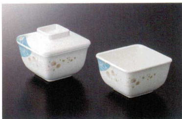
GH-306 角小鉢(身) 97×97×60 84 320cc ¥1,180 GH-306F 角小鉢(蓋) 98×98×25 ¥820