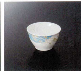
GH-361 湯呑 95×58 210cc ¥670