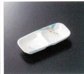
GH-405 2切角小皿 140×75×21 ¥820