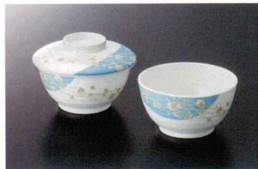
GH-167 丸小鉢(身) 123 110×60 83 330cc ¥970 GH-167F 丸小鉢(蓋) 120×28 ¥820