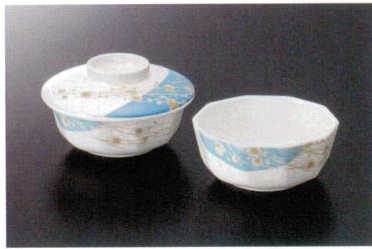
GH-164 十角小鉢(身) 125 109×47 70 250cc ¥970 GH-164F 十角小鉢(蓋) 124×28 ¥820