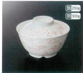
GHS-221 飯井(身) T-3 141×74 飯 250g 粥 300g 141×74 飯 98 650cc ¥1,240 GHS-222 飯井(蓋) 128×37 ¥760