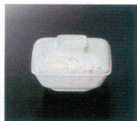
G-4171 角煮物碗(身)(アイボリー) T-3 130×130×45 飯 73 400cc ¥1,120 GHS-418 角煮物碗(蓋) 126×126×32 ¥1,030