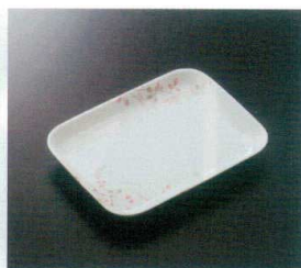
GHS-407 角皿 T-3 165×125×21 ¥1,180 299-OP ¥460 飯 61 湯 176頁