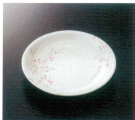
GHS-477 16.5cm丸皿 T-3 165×29 ¥1,070 P-203 ¥470 飯 63 湯 172頁