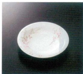
GHS-478 14.5cm丸皿 T-3 145×25 ¥810 P-300NI ¥420 飯 54 湯 173頁