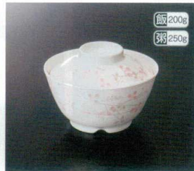
GHS-223 飯井(身) T-3 130×69 飯 200g 粥 250g 130×69 飯 91 500cc ¥1,150 GHS-224 飯井(蓋) 117×34 ¥700