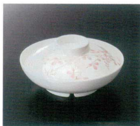
G-3171 煮物碗(身)(アイボリー) T-3 162×47 飯 74 490cc ¥1,460 GHS-114 蓋 150×39 ¥780