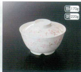
GHS-225 飯井(身) T-3 125×65 飯 170g 粥 220g 125×65 飯 85 450cc ¥1,070 GHS-226 飯井(蓋) 113×31 ¥700