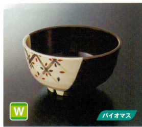
M-150C 15cm井(陶庵) W 150×76 760cc ¥1,710 F-37 ¥770 1 83 179 頁