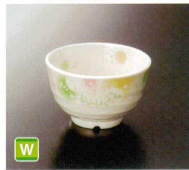
M-121E 12cm井(稍春) W 119×74 440cc ¥1,480 F-34 ¥590 1 77 179 頁