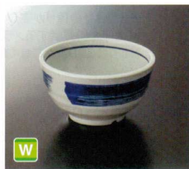
M-120B 13cm井(刷毛目) W 133×74 560cc ¥1,620 F-31 ¥590 1 76 179 頁