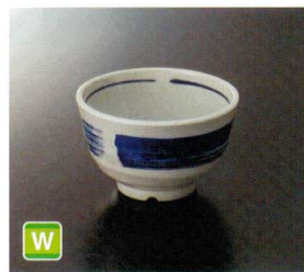
M-121B 12cm井(刷毛目) W 119×74 440cc ¥1,480 F-34 ¥590 1 77 179 頁