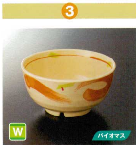
M-150A 15cm井(花雜子) W 150×76 760cc ¥1,770 F-37 ¥770 1 83 179 頁