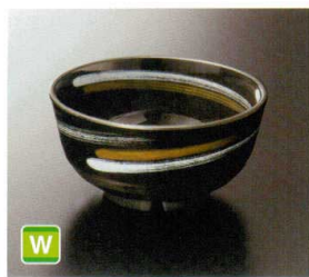
M-150D 15cm井(双轡) W 150×76 760cc ¥1,770 F-37 ¥770 1 83 179 頁