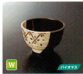
M-121C 12cm井(陶庵) W 119×74 440cc ¥1,400 F-34 ¥590 1 77 179 頁