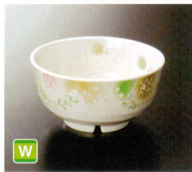
M-150E 15cm井(稍春) W 150×76 760cc ¥1,770 F-37 ¥770 1 83 179 頁