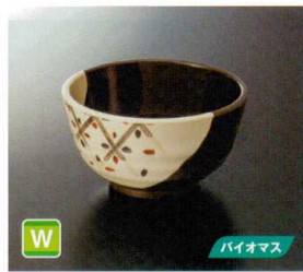
M-120C 13cm井(陶庵) W 133×74 560cc ¥1,550 F-31 ¥590 1 76 179 頁