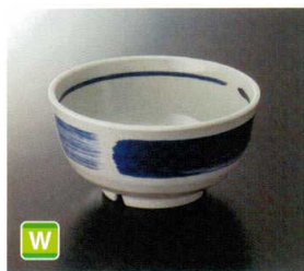
M-150B 15cm井(刷毛目) W 150×76 760cc ¥1,770 F-37 ¥770 1 83 179 頁