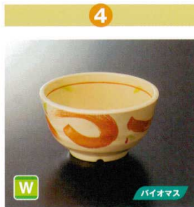
M-120A 13cm井(花雜子) W 133×74 560cc ¥1,620 F-31 ¥590 1 76 179 頁