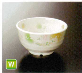
M-120E 13cm井(稍春) W 133×74 560cc ¥1,620 F-31 ¥590 1 76 179 頁