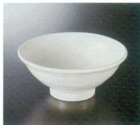
M-468HYJ 麺丼(白釉地) 123 192×81 1010cc ¥1,370