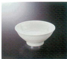
M-466HYJ 飯丼(白釉地) 123 156×67 550cc ¥830