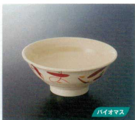
M-465B 麺丼(いろは) 123 177×74 800cc ¥1,630