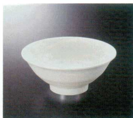
M-465HYJ 麺丼(白釉地) 123 177×74 800cc ¥1,160