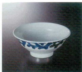
M-465C 麺丼(蒼玉) 123 177×74 800cc ¥1,630