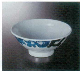
M-468C 麺丼(蒼玉) 123 192×81 1010cc ¥1,960