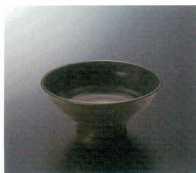
M-466KYJ 飯丼(黒釉地) 123 156×67 550cc ¥830