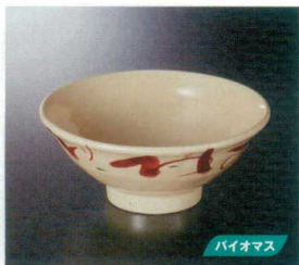
M-468B 麺丼(いろは) 123 192×81 1010cc ¥1,960