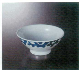
M-466C 飯丼(蒼玉) 123 156×67 550cc ¥1,170