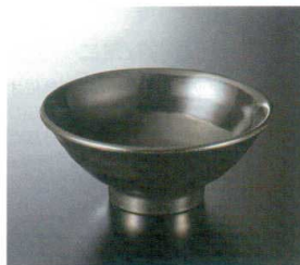
M-468KYJ 麺丼(黒釉地) 123 192×81 1010cc ¥1,370