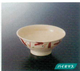
M-466B 飯丼(いろは) 123 156×67 550cc ¥1,170