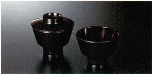
M21104KTM スープボール(身)(黒釉地内溜) 73 104×71 94 270cc ¥800 F21104KYJ スープボール(蓋)(黒釉地) 106×29 ¥490