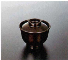
M29001UR 吸物椀(身)(うるみ) 73 96×62 77 230cc ¥620 F29001UR 吸物椀(蓋)(うるみ) 84×26 ¥440