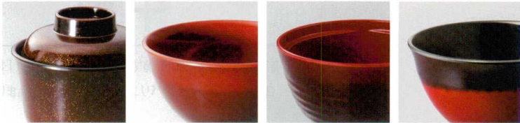
金彩:金梨子地の風合い 春慶:艶なしのマット調 溜内朱:グラデーション 東雲:水平に2色