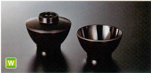
M-435UR 汁椀(身)(うるみ) 73 100×56 78 210cc ¥1,000 M-436UR 汁椀(蓋)(うるみ) 102×28 ¥660