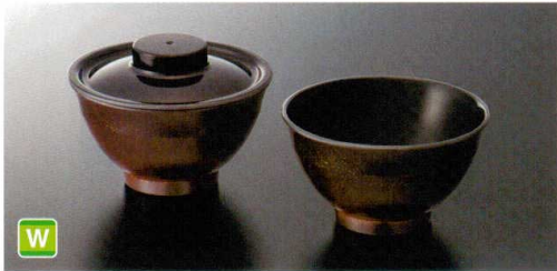
M-144KK 汁椀(身)(金彩) 73 115×66 85 310cc ¥1,130 M-145BK こぼれにくい蓋(黒) 117×31 ¥660