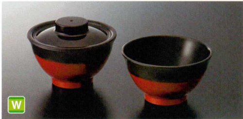
M-144SN 汁椀(身)(東雲) 73 115×66 85 310cc ¥1,130 M-145BK こぼれにくい蓋(黒) 117×31 ¥660