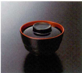
M-223BKS 汁椀(身)(黒内朱) 107×60 69 280cc ¥760 M-224BK 汁椀(蓋)(黒) 96×25 ¥550