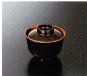
M29001URS 吸物椀(身)(うるみ内朱) 73 96×62 77 230cc ¥620 F29001URS 吸物椀(蓋)(うるみ内朱) 84×26 ¥440