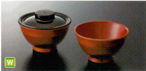
M-144SK 汁椀(身)(春慶) 73 115×66 85 310cc ¥1,260 M-145BK こぼれにくい蓋(黒) 117×31 ¥660