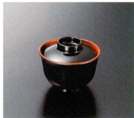
M29001BKS 吸物椀(身)(黒内朱) 73 97×62 77 230cc ¥550 F29001BKS 吸物椀(蓋)(黒内朱) 85×26 ¥380