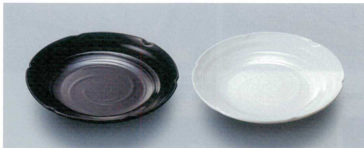
G-710KYU 盛鉢(黒釉) 300×50 1800cc ¥3,520 P-214 ¥1,890 83 掲 178頁

焼きたて、揚げたてのおかず、野菜をたくさん使った 和そうざい、サラダなどの盛込みに。 鍋料理にも欠かせないアイテムも豊富にご用意しています。