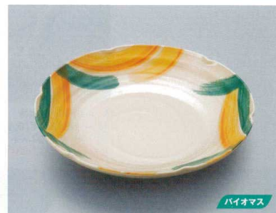
G-710WO 盛鉢(ウッディランド) 300×50 1800cc ¥3,970 P-214 ¥1,890 83 掲 178頁