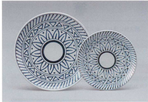
GG-513 尺3盛込皿(弥生) 392×49 ¥7,250