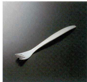
AO-12 フラットライトフォーク 185×24 33g 18-8 ¥830