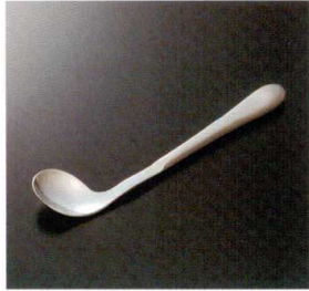
AO-05 スプーン右曲がり(左利き用) 180×34 40g 18-8 ¥3,150