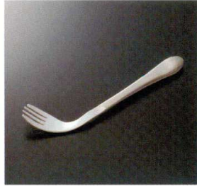
AO-06 フォーク右曲がり(左利き用) 180×24 33g 18-8 ¥3,150