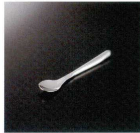
TL-01 スリムライトUDスプーン 147×29 22g 18-8 ¥1,270