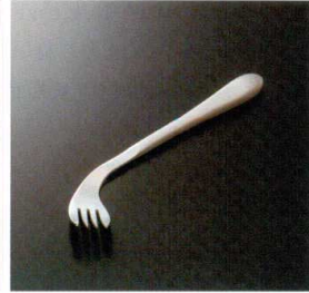
AO-08 フォーク左曲がり(右利き用) 180×24 33g 18-8 ¥3,150