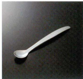
AO-13 フラットライトスプーンS 180×30 34g 18-8 ¥830