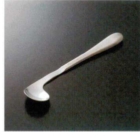
AO-07 スプーン左曲がり(右利き用) 180×34 40g 18-8 ¥3,150