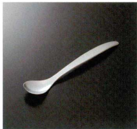
AO-11 フラットライトスプーンM 185×34 36g 18-8 ¥830