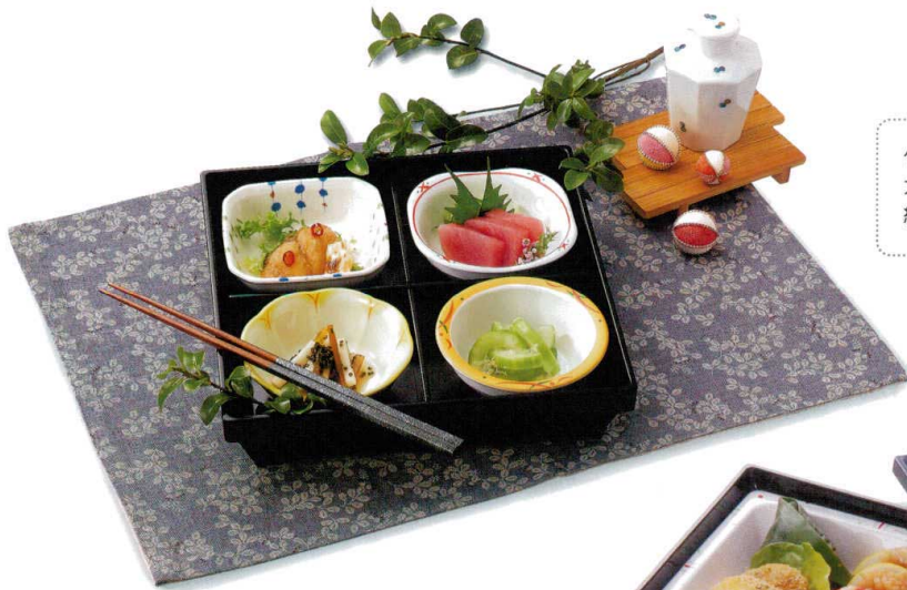
弁当箱(身・蓋) THP-07G 中子(左上から時計回りに) M-124EA / M-125EA / M-123EB / M-126EB 十字仕切 T-07S 合計価格 ¥8,210 (中子は240頁に掲載)