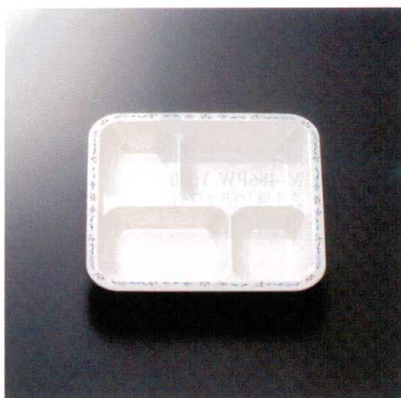
M-118MIZ 7.5寸旬彩弁当中子(瑞穂) 212×212×35 メラミン ¥2,180