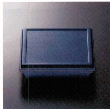
THP-07B 7.5寸旬彩弁当(身・蓋)(ブルー内黒) 173 233×233×64 ¥4,500