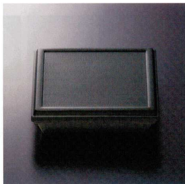
THP-07G 7.5寸旬彩弁当(身・蓋)(グリーン内黒) 173 233×233×64 ¥4,500