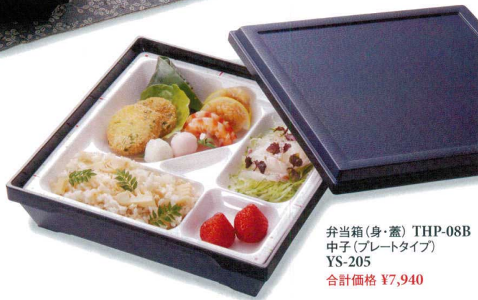
弁当箱(身・蓋) THP-08B 中子(プレートタイプ) YS-205 合計価格 ¥7,940