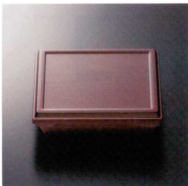
THP-07TM 7.5寸旬彩弁当(身・蓋)(溜内黒) 173 233×233×64 ¥4,500