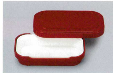
NR-6R システムレンジ弁当(身・蓋)(M)(レッド) 199×119×52 ¥4,520 中子セット例 TPM-3 合計価格 ¥5,880(弁当箱(身・蓋)・中子)