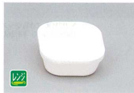
TPM-1.5 PP中子(中)(ホワイト) 90×101×35 200cc ¥780