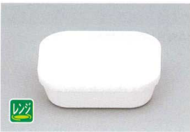
TPM-2 PP中子(大)(ホワイト) 120×101×35 270cc ¥1,100