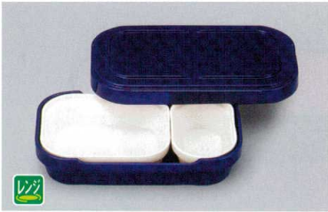
NR-6B システムレンジ弁当(身・蓋)(M)(ブルー) 199×119×52 ¥4,520 中子セット例(左から) TPM-2/TPM-1 合計価格 ¥6,310(弁当箱(身・蓋)・中子)