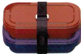
★B-610 システムレンジ弁当三段用バンド 610 ¥600 ★B-490 システムレンジ弁当二段用バンド 490 ¥540 ※バンドは受注生産です。