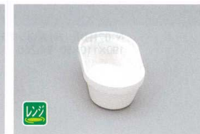
TPM-1 PP中子(小)(ホワイト) 60×102×35 120cc ¥690

システムレンジ弁当対応/システム食器・システム食器ニュークリックの中子組み合わせ例です。