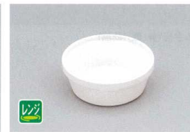
TPM-R PP中子(丸)(ホワイト) 90×35 160cc ¥750