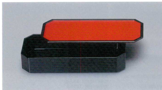
N-08BK 8寸角切システム弁当(身・蓋)(総黒) 247×110×50 ¥4,710

バリエーション豊富な中子の組み合わせにより、 行事食はもちろんのこと多用途にご利用いただけます。