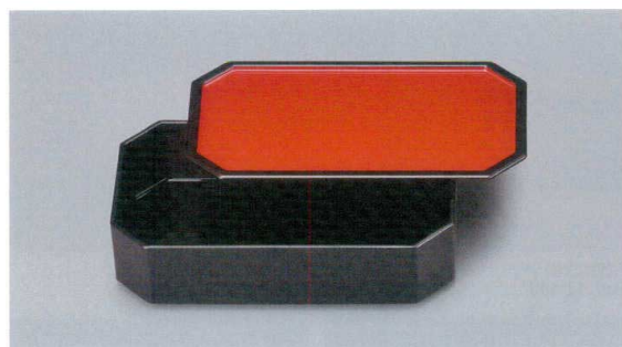
N-07HBK 7寸角切システム弁当(身・蓋)(総黒) 190×110×50 ¥4,260