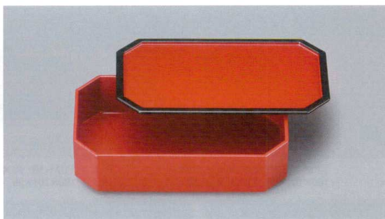
N-07HR 7寸角切システム弁当(身・蓋)(総朱) 190×110×50 ¥4,260

システム弁当対応/システム食器・システム食器ニュークリックの中子組み合わせ例です。