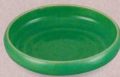
EA-32 スープ皿(緑釉) 152×38 380cc ¥4,690