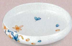
EA-31 スープ皿(花憐) 152×38 380cc ¥5,450