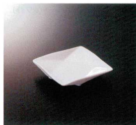
EL-517-W 10cm角皿 (ホワイト) 104×104×22 ¥1,280