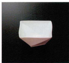
EL-526-W 10cm角鉢 (ホワイト) 104×104×49 230cc ¥2,060