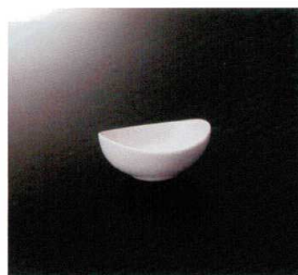
EL-503-W オーバルボール (S) (ホワイト) 91×70×37 60cc ¥1,120