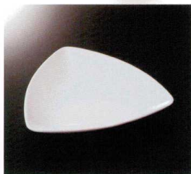
EL-511-W トリオプレート (L) (ホワイト) 182×179×31 ¥2,540