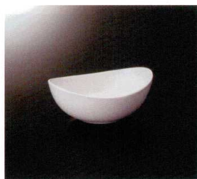
EL-502-W オーバルボール (M) (ホワイト) 129×100×50 200cc ¥1,430