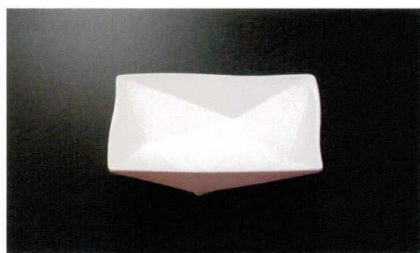
EL-527-W 16cm角深皿 (ホワイト) 163×163×38 ¥3,740