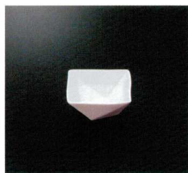
EL-525-W 8cm角鉢 (ホワイト) 82×82×36 120cc ¥1,540