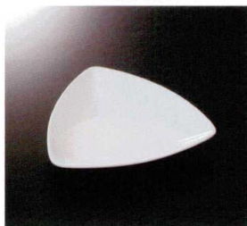
EL-512-W トリオプレート (M) (ホワイト) 159×156×25 ¥2,110