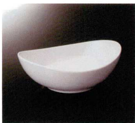
EL-507-W オーバルボール (L) (ホワイト) 183×138×65 490cc ¥2,800