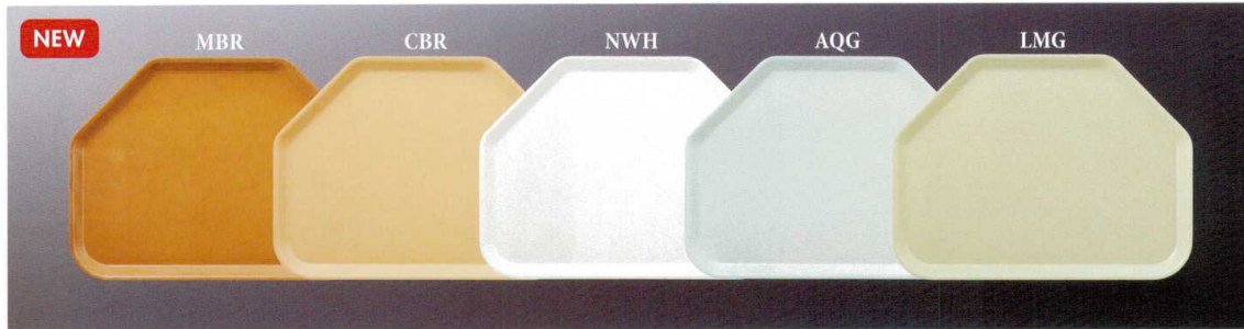
ST-3445 六角トレイ 450×340×20 ¥2,610 MBR(モカブラウン)・CBR(キャメルブラウン)・NWH(ナチュラルホワイト)・AQG(アクアグレイ)・LMG(ライムグリーン)