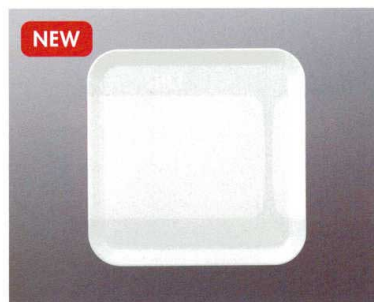
STL-3000NWH 正角トレイ(ナチュラルホワイト) 300×300×24 ¥1,810