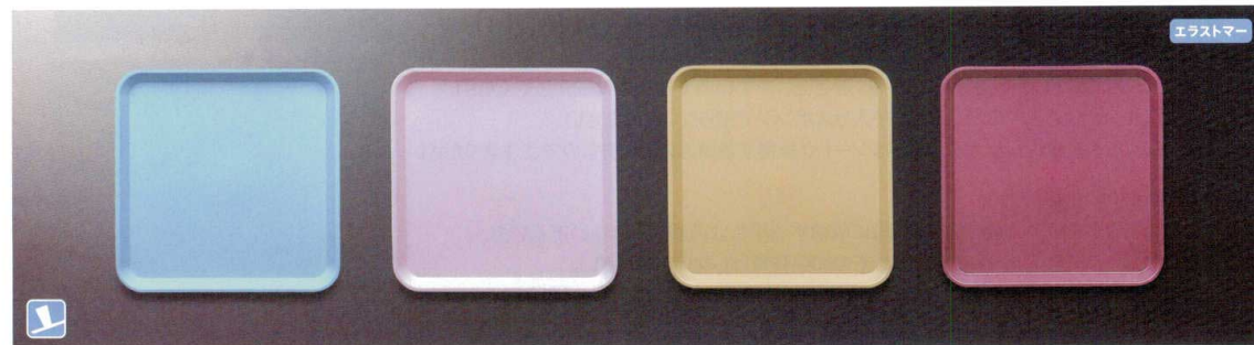
TC3232B 角トレイ(ブルー) 326×326×19 ¥1,290 TC3232LB 角トレイ(ラベンダー) 326×326×19 ¥1,290 TC3232BR 角トレイ(ブラウン) 326×326×19 ¥1,290 TC3232WN 角トレイ(ワイン) 326×326×19 ¥1,290