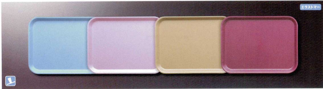
TC3344B 長角トレイ(特大)(ブルー) 435×325×22 ¥1,890 TC3344LB 長角トレイ(特大)(ラベンダー) 435×325×22 ¥1,890 TC3344BR 長角トレイ(特大)(ブラウン) 435×325×22 ¥1,890 TC3344WN 長角トレイ(特大)(ワイン) 435×325×22 ¥1,890