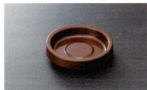
HW-38BR 灰皿(ブラウン) 110×25 ¥660