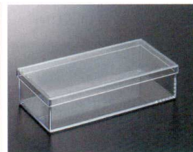
HWA-5 アメニティボックス 217×106×56 スチロール ¥770