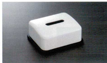
HW-1405 ハーフティッシュボックス(黒底) 170×150×70 ¥2,080