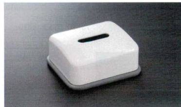
HW-1405E ハーフティッシュボックス(グレイ底) 170×150×70 ¥2,240