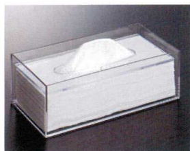
HWA-2 ティッシュボックス 244×125×86 スチロール ¥1,030