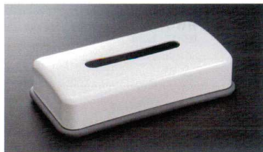
HW-1304E ティッシュボックス(グレイ底) 290×150×60 ¥3,140