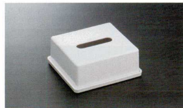
HW-405MI ハーフティッシュボックスカバー 147×135×62 66 ¥1,040 HW-415FI ハーフトレイ 157×145×10 ¥830 ※カバーとトレイは別売りです