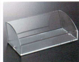
HWA-1 アメニティバスケット 滑り止めシート付き 257×145×89 アクリル ¥2,930