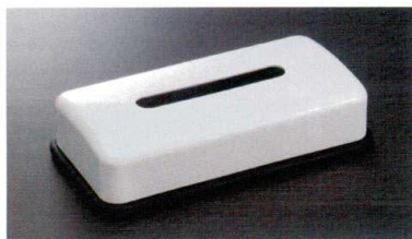
HW-1304 ティッシュボックス(黒底) 290×150×60 ¥3,020