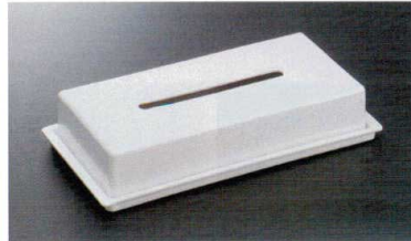
HW-304MI ティッシュボックスカバー 267×132×53 58 ¥1,630 HW-304FI トレイ 290×147×17 ¥1,250 ※カバーとトレイは別売りです