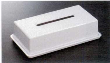
HW-414MI ティッシュボックスカバー 278×143×76 79 ¥2,030 HW-404FI トレイ 294×162×16 ¥1,250 ※カバーとトレイは別売りです