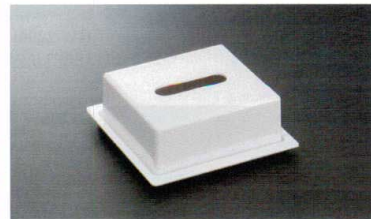
HW-405MI ハーフティッシュボックスカバー 147×135×62 66 ¥1,040 HW-405FI ハーフトレイ 168×168×16 ¥920 ※カバーとトレイは別売りです