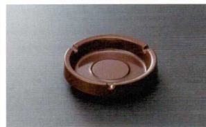
HW-38LBR 灰皿(ブラウン) 110×25 ¥670