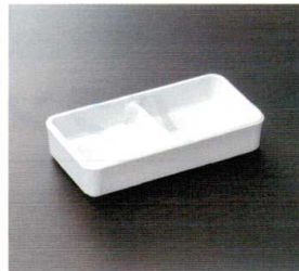
HW-213I ティーバッグトレイ 150×79×30 ¥670