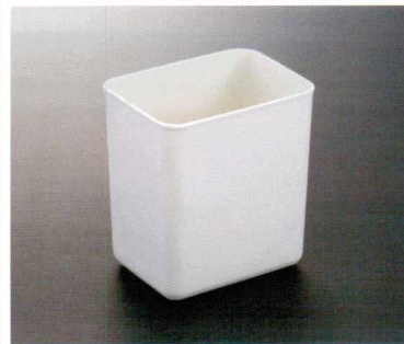
HW-501I 角くず入れ 200×150×220 FRP ¥3,040