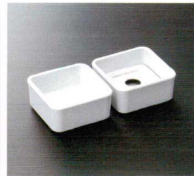
HW-206I ティーバッグボックス 78×78×36 ¥450 HW-207I インナープレート 65×65×10 ¥370