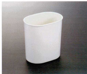
HW-503I 小判くず入れ(S) 210×145×220 FRP ¥3,040