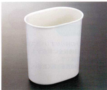
HW-502I 小判くず入れ(L) 260×180×280 FRP ¥3,770