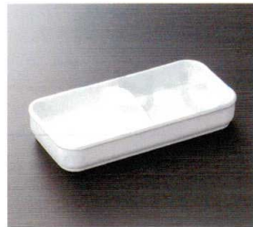
HW-2105I ティーバッグトレイ 175×85×30 ¥680