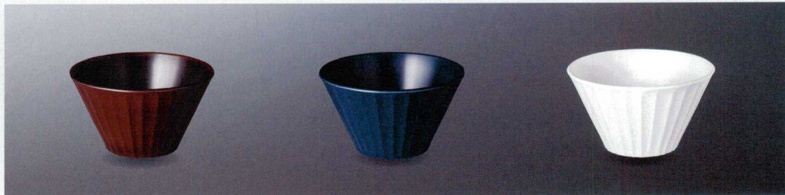
M35101RTM マルチボール(溜) TS 160×90 850cc ¥1,700 P-226 ¥510 f 104 梅 175頁