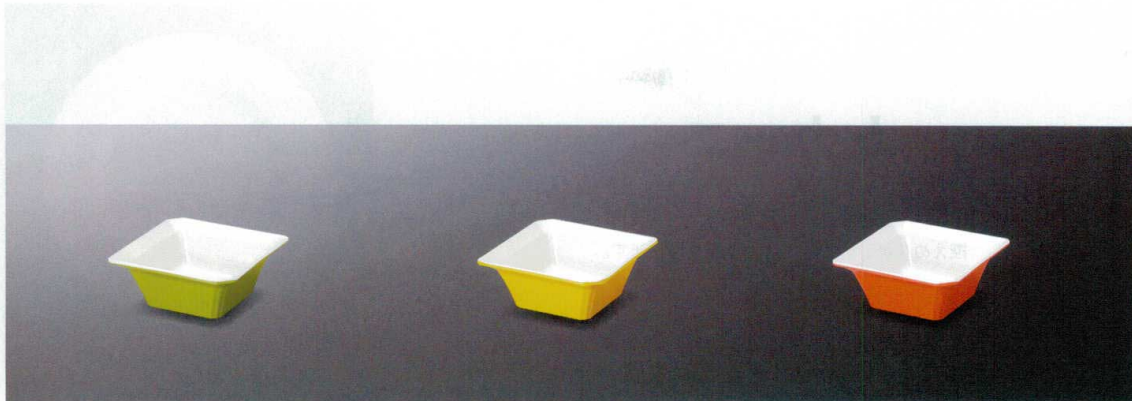
M25003CG 角小鉢(グリーン) 88×88×36 110cc ¥630