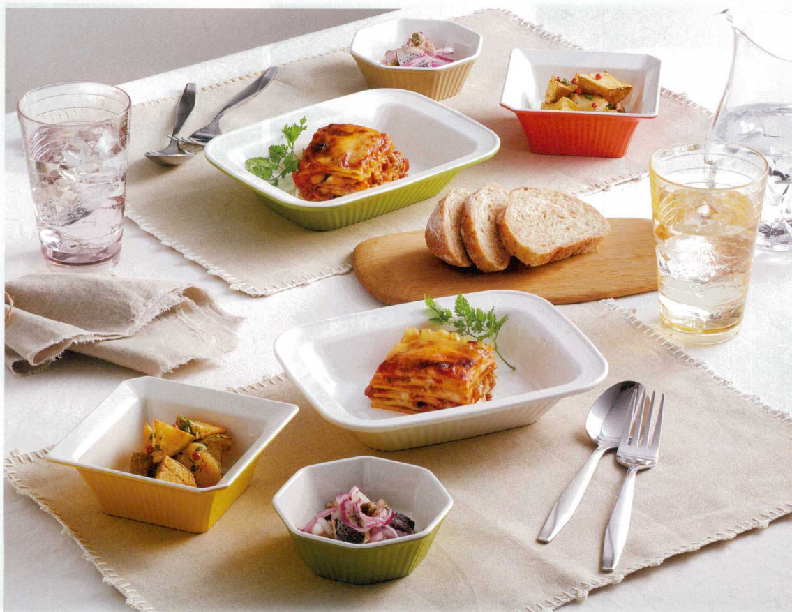
M25003PW 角小鉢(バルホワイト) 88×88×36 110cc ¥640