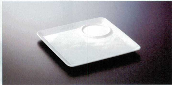
M-303PW フリープレート TC3 225×225×16 ¥1,460 P-220 ¥810 T 58 冊 177頁