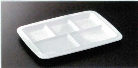
M-335PW ビュブレ5 TC1 270×202×19 ¥1,700