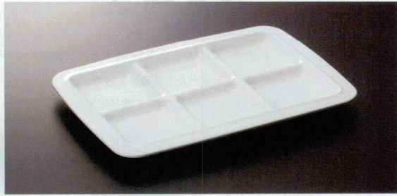
M-336PW ビュブレ6 TC1 270×192×19 ¥1,620