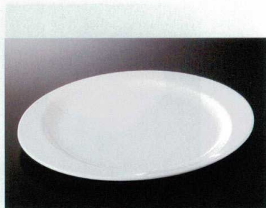
M-305PW プレート TC3 270×230×18 ¥2,040