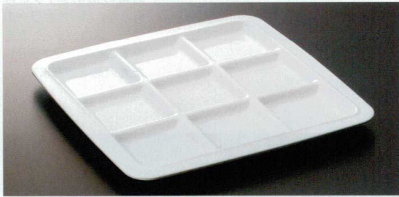
M-339PW ビュブレ9 TC3 270×270×19 ¥2,590