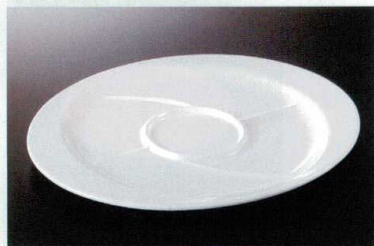
M-304PW 5っ仕切プレート TC3 270×230×18 ¥2,080