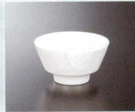
M21103I 飯碗(身)(アイボリー) 113×62 290cc ¥810