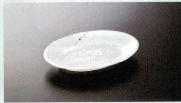
M-193UNA オーバルプレート(ビジュール) 171×121×26 170cc ¥1,460