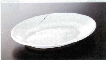
M-191UNA オーバルプレート(ビジュール) 260×185×38 620cc ¥2,250