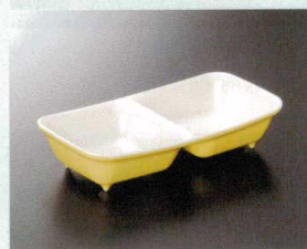
M-27YMW 二連小鉢(イエロー) 190×100×40 ¥1,060