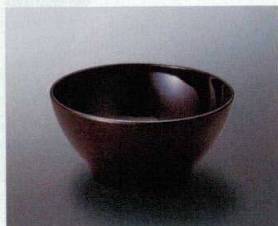
M-16UR ボール(うるみ) 136×65 530cc ¥970