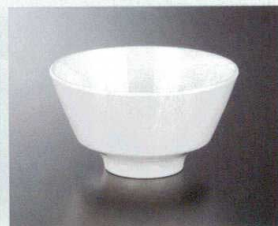
M21101I 飯碗(身)(アイボリー) 139×77 580cc ¥1,020