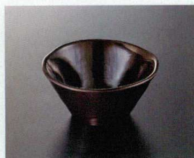
M-480UR 12cm丸小鉢(うるみ) 120×59 300cc ¥830