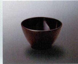
M-20UR ボール(うるみ) 106×63 250cc ¥730