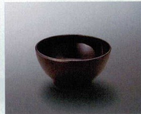
M-13UR ボール(うるみ) 112×56 280cc ¥760