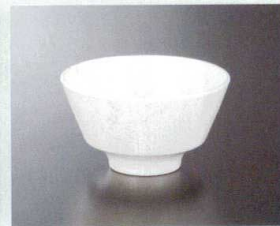
M21102I 飯碗(身)(アイボリー) 125×71 410cc ¥940