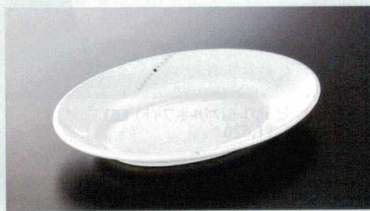
M-192UNA オーバルプレート(ビジュール) 237×168×35 460cc ¥2,100