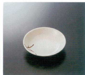
G-173SI 14cm深皿 T-1 140×30 230cc ¥820 ☎ P-217 ¥510 ◆ 67 📖 173頁