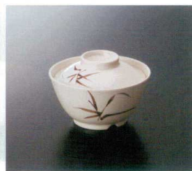
G-225SI 飯井(身) T-3 125×65 ◆ 85 450cc ¥1,070 G-226SI 飯井(蓋) 113×31 ¥700