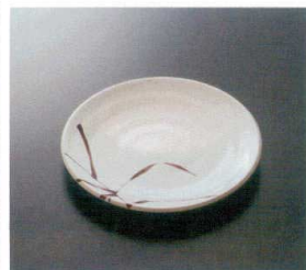
G-176SI 18cm丸皿 T-3 183×21 ¥990 ☎ 296-OP ¥480 ◆ 61 📖 172頁