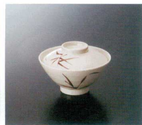
G-136SI 飯茶碗(身) T-3 123×61 ◆ 85 310cc ¥700 G-136FSI 飯茶碗(蓋) 112×29 ¥600