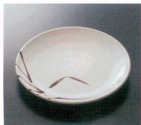
G-175SI 23cm丸皿 T-3 226×29 ¥1,320