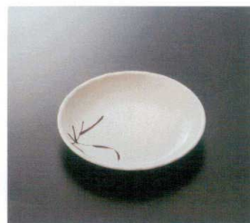
G-172SI 16.5cm菜皿 T-1 165×25 ¥920 ☎ P-203 ¥470 ◆ 57 📖 172頁