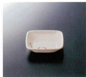
G-234SI 胴張新香皿 104×104×22 ¥660