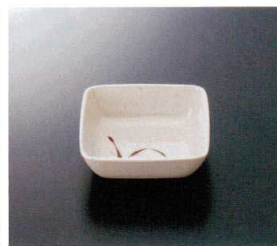
G-36SI 角鉢 109×109×35 220cc ¥890