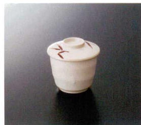
G-146Z むし茶碗(身)(石焼) 特選 81×72 特選 87 220cc ¥550 G-146FSI むし茶碗(蓋) 90×20 ¥400