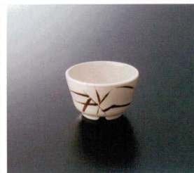
G-161SI 湯呑 88×53 180cc ¥600