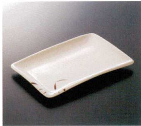
K-108SI 角皿 204×139×19 ¥1,360