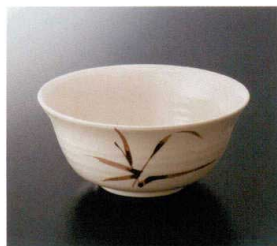
G-520SI 麺丼 特選 180×81 1150cc ¥1,770 302-OP ¥460 特選 97 特選 175頁