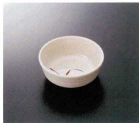
G-104SI 小鉢 特選 111×43 240cc ¥720 P-301NI ¥420 特選 64 特選 174頁