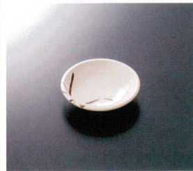
G-148SI 新香皿 99×23 ¥490