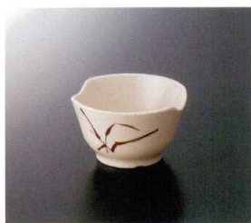
43-ASI 小鉢 105×100×61 210cc ¥990