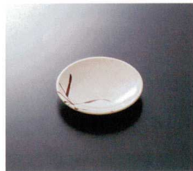
G-153SI 新香皿 110×18 ¥500