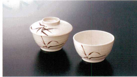
G-167SI 丸小鉢(身) 特選 110×60 特選 83 330cc ¥970 G-167FSI 丸小鉢(蓋) 120×28 ¥820