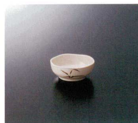
G-138SI のぞき 特選 76×29 ¥520