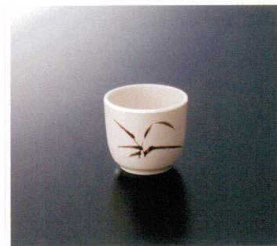
G-163SI 長湯呑 71×63 150cc ¥690