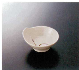
G-144SI 天水 122×117×59 210cc ¥760