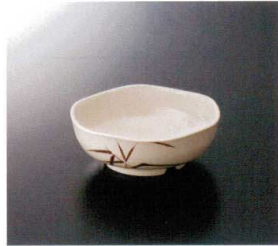
G-137SI 刺身鉢 特選 147×54 490cc ¥1,320