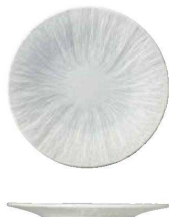
U18-LA009-AH ラグーン 21cm平皿 ¥2,300 φ21.2×H1.7cm