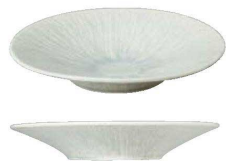
U18-LA021-AH ラグーン 27cm深皿 ¥4,100 φ27.2×H4.6cm