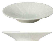
U18-LA020-AH ラグーン 20cm深皿 ¥2,700 φ20.6×H3.7cm