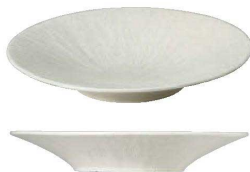
U18-LA022-AH ラグーン 31cm深皿 ¥5,500 φ30.9×H5cm