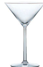
RN-12233CS マティーニ ¥2,500 (税込¥2,750) 24コ入(6×4) φ117×H181・M117 235ml 49 06678 159155