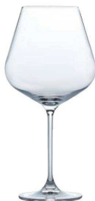
RN-12285CS ブルゴーニュ ¥3,100 (税込¥3,410) 24コ入(6×4) φ76×H252・M122 920ml 49 06678 169475