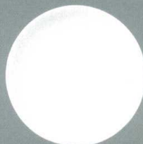
11-119-3-51060001 ¥800 16cm皿 16×2