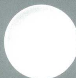
11-119-4-48050001 ¥700 12cm皿 11.9×1.8