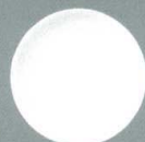
11-119-5-50604001 ¥600 10cm皿 10×2