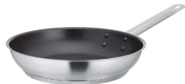
⑧ KYS NEWPRO IHエクスカリバーフライパン [AFPA-02] △ IH