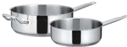
⑤ KYS NEWPRO IH片手浅型鍋(蓋無) [AKAA-01] IH