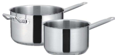
④ KYS NEWPRO IH片手深型鍋(蓋無) [AKFA-01] IH