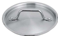
⑦ KYS NEWPRO 鍋蓋 [AFTA-01]