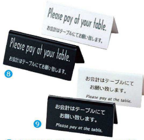
8 山型お会計テーブルスタンド(両面) LI-6E [QKKT-04] 目