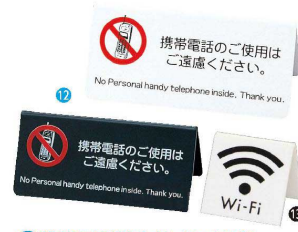
12 携帯電話禁止サイン IP-63 [QKKS-05] 目