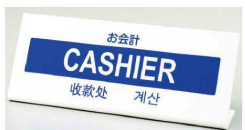
14 多言語プレート TGP1025-12 [VTKP-12] △ 目

多言語プレート 日本語・英語・中国語・韓国語が一つのプレートに記載しております。