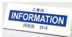
15 多言語プレート TGP1025-13 [VTKP-13] △ 目