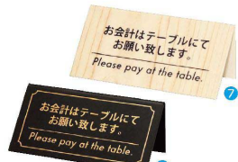
6 会計サイン KP-1 黒 [QKKT-01] 目