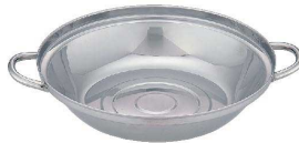
⑥ UK18-0 寄せ鍋