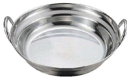
⑤ 18-0 モモ寄せ鍋