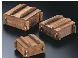
⑫ 木製 せいろ蒸しセット [RSIR-01]