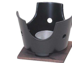
⑧ KYS アルミ丸コンロ [RAKO-08] ◇