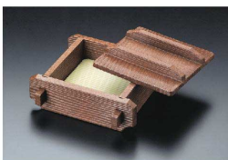
⑪ 樹脂製 せいろ蒸しセット