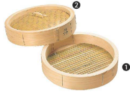
① 桧 中華セイロ 身 [ASIR-46] ◇