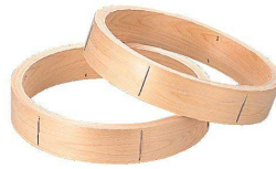
③ 桧 中華セイロ 台輪 [ASIR-47] ◇