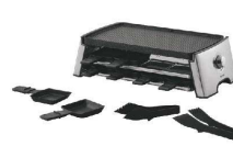
8 ピーコック ホームパーティグリル

平面 / 波型、1枚 2役で両面使えるプレート。用途に合わせて使い分けできます。