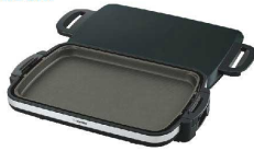
1 象印 ホットプレート やきやき