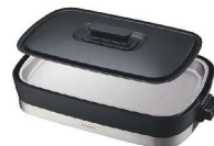
6 ピーコック ステンレスホットプレート

サイズ:516×308×H79 プレートサイズ:370×234×10 電源:単相100V 50/60Hz 消費電力:1.2kW 温度調節範囲:保温~230°C 重量:2.3kg ●新開発の「3次元アーチ構造」と搭載したプレートで、発煙量・油ハネ大幅カットを実現!プレートは丸洗いができます。 ●左側の平面ゾーンではタレを絡めて焼きたいメニューや、中央の波型部分では難しい食材も調理可能です。右側の傾斜ゾーンでは、食材から出る余分な油を流しながら焼き上げるのでヘルシーに仕上がります。