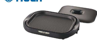
3 タイガー ホットプレート