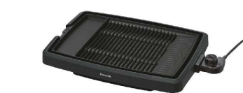
5 ピーコック 電気焼肉器

サイズ:523×385×H127(蓋含む) プレートサイズ:421×309×H24 電源:単相100V 50/60Hz 消費電力:1.3kW 温度調節:保温~250°C コード長さ:3m 重量:6.9kg 付属品:専用金属ヘラ ●平面、穴あき波型の2種のプレートが付いています。 ●本体が立てて収納できるため狭い場所にも収納が可能です。 ●完全分離構造で本体ガードが丸洗いができます。