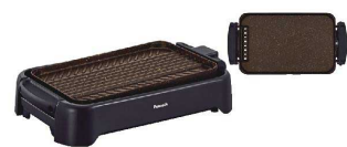
7 ピーコック 両面グリルプレート

サイズ:530×291×130 プレートサイズ:380×240×32 電源:単相100V 50/60Hz 消費電力:1.0kW 温度調節範囲:保温~約210°C 重量:4.1kg ●ノンコートなので、プレート上で食材を切り分けることができ、金属ターナーやナイフの使用もOK。 ●プレートは取り外しができて、シンクでも丸洗いしやすいコンパクト設計。