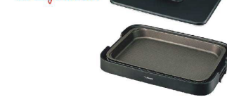
2 象印 ホットプレート やきやき