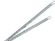
⑬ ステンレス 火バサミ [ESMB-02] ◆ 45cm 17-1056-1301 ¥290 60cm 17-1056-1302 ¥510