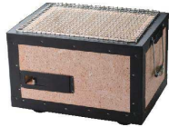
① 炭火バーベキューコンロ BQ-8F号 (2~4人用) [EBKQ-06] ◇ 国 17-1056-0101 ¥27,500 サイズ:310×230×H200 重量:6.5kg 材質:珪藻土 付属品:焼アミ1枚