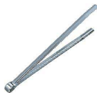
⑪ 18-0 炭バサミ (板厚0.7mm) [ESMB-05] ■ 19.5cm 17-1056-1101 ¥340 24.0cm 17-1056-1102 ¥430 30.0cm 17-1056-1103 ¥490 36.5cm 17-1056-1104 ¥580 ●焼き肉用トングとしても最適です。