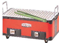
⑤ バーベキューコンロ (角型) [RBBK-02] ◇ 国 17-1056-0501 ¥17,400 サイズ:375×215×H175 付属品:焼アミ、火ばさみ、 ステンレス火皿2枚