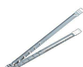
⑫ 18-0 炭バサミ 厚口 (板厚1.0mm) [ESMB-06] ◆ 19.5cm 17-1056-1201 ¥380 24.0cm 17-1056-1202 ¥400 30.0cm 17-1056-1203 ¥510 36.5cm 17-1056-1204 ¥630