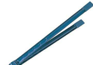
⑭ 鉄製 火バサミ [ESMB-03] ◆ 44cm 17-1056-1401 ¥450 60cm 17-1056-1402 ¥620