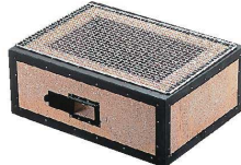
② 炭火バーベキューコンロ BQ-12号 (4~8人用) [EBKQ-03] ◇ 国 17-1056-0201 ¥49,700 サイズ:460×350×H200 重量:14kg 材質:珪藻土 付属品:焼アミ1枚