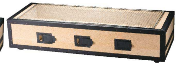
④ 炭火バーベキューコンロ BQ-22号 (8~15人用) [EBKQ-01] ◇ 国 17-1056-0401 ¥88,200 サイズ:920×350×H200 重量:25.0kg 材質:珪藻土 付属品:焼アミ1枚