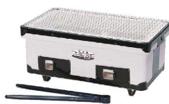
⑥ バーベキューコンロ (角型ワイド) [RBBK-03] 国 17-1056-0601 ¥17,000 サイズ:410×235×H180 付属品:焼アミ、火ばさみ、 ステンレス火皿2枚