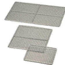
⑩ KYS 業務用焼網 [EAMI-08] ◆ サイズ 24号 240×210 17-1056-1001 ¥2,200 27号 270×240 17-1056-1002 ¥2,700 30号 300×270 17-1056-1003 ¥3,200 33号 330×300 17-1056-1004 ¥3,900 36号 360×330 17-1056-1005 ¥4,600 39号 390×360 17-1056-1006 ¥4,800 45号 450×400 17-1056-1007 ¥5,900 50号 500×400 17-1056-1008 ¥6,200 60号 600×400 17-1056-1009 ¥7,600 材質:鉄、クロームメッキ ●φ2.5mm クリップ13mm目 ※中央部補強線: 24~30号/なし 33~39号/1本あり 45~60号/2本あり