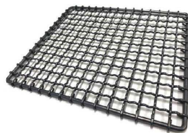
⑨ KYS 業務用焼網(窒化鉄) [EAMI-07] ◆ サイズ 24号 240×210 17-1056-0901 ¥4,100 27号 270×240 17-1056-0902 ¥4,600 30号 300×270 17-1056-0903 ¥5,000 材質:鉄(窒化処理) ●φ2.5 クリップ13mm目 ●高い熱効率と高い耐食性を併せ持つ窒化鉄使用。

メッキやコーティング塗装とは製造原理が全く異なり、鉄に窒素原子を浸透させます。窒化処理による効果が半永久的に持続するため、大幅なコストダウンが見込めます。