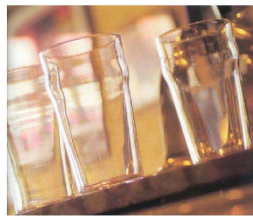
⑰ ノニック ビアグラス 340(単品) [SBGI-22] 洗 17-1084-1701 ¥680 サイズ: φ77(最大径)×H127 340cc ※バラは個装なしの包装となります。