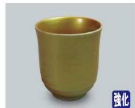
⑪ KY10-30 金彩湯呑 [SMTU-30] 納 画 記 17-1166-1101 ¥2,600 サイズ:φ67×H80 180cc 磁器製