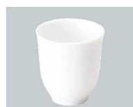
㉔ 白虎 湯呑 [SKDD-01] 納 画 記 17-1166-2401 ¥1,240 サイズ:φ78×H84 215cc 磁器製