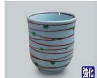
⑦ KY10-27 錦うず潮湯呑 [SMTU-27] 納 画 記 17-1166-0701 ¥1,800 サイズ:φ67×H80 180cc 磁器製