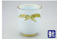
③ KY6-03 金彩扇長湯呑 [SMTT-F6] 納 画 記 17-1166-0301 ¥1,900 サイズ:φ67×H82 170cc 磁器製