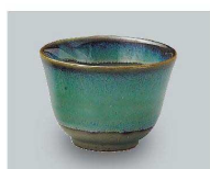
㉓ 均窯 小干茶 [SYYN-02] 納 画 記 17-1166-2301 ¥590 サイズ:φ83×H58 120cc 陶器製