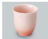
㉙ 花霞 湯呑 [SKDD-06] 納 画 記 17-1166-2901 ¥1,170 サイズ:φ78×H84 215cc 磁器製