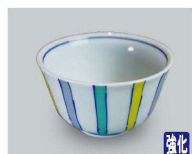
㉑ KY10-46 色十草干茶 [SMTU-46] 納 画 記 17-1166-2101 ¥2,300 サイズ:φ88×H53 130cc 磁器製