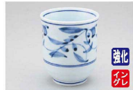
① KY6-01 染付唐草長湯呑 [SMTT-F4] 納 画 記 17-1166-0101 ¥2,050 サイズ:φ67×H82 170cc 磁器製

強化 このマークは洗浄機でとれない加色方法の商品です。 ※材質の明記がない商品は、通常磁器製となります。