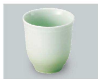
㉘ 重萌 湯呑 [SKDD-05] 納 画 記 17-1166-2801 ¥1,170 サイズ:φ78×H84 215cc 磁器製