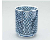
⑨ KY6-16 京祥瑞切立湯呑 [SMTT-G9] 納 画 記 17-1166-0901 ¥1,550 サイズ:φ67×H84 200cc 磁器製