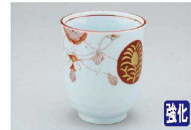
⑤ KY6-05 錦瓔珞長湯呑 [SMTT-F8] 納 画 記 17-1166-0501 ¥1,950 サイズ:φ67×H82 170cc 磁器製