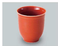
㉖ 朱雀 湯呑 [SKDD-03] 納 画 記 17-1166-2601 ¥1,300 サイズ:φ78×H84 215cc 磁器製