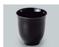
㉕ 玄武 湯呑 [SKDD-02] 納 画 記 17-1166-2501 ¥1,300 サイズ:φ78×H84 215cc 磁器製