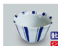
⑳ KY10-45 染付十草干茶 [SMTU-45] 納 画 記 17-1166-2001 ¥2,600 サイズ:φ92×H57 140cc 磁器製