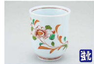
② KY6-02 錦草花長湯呑 [SMTT-F5] 納 画 記 17-1166-0201 ¥1,700 サイズ:φ67×H82 170cc 磁器製