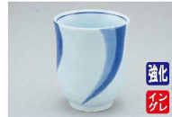
④ KY6-04 ネジ十草長湯呑 [SMTT-F7] 納 画 記 17-1166-0401 ¥1,850 サイズ:φ67×H82 170cc 磁器製