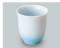
㉗ 青流 湯呑 [SKDD-04] 納 画 記 17-1166-2701 ¥1,170 サイズ:φ78×H84 215cc 磁器製