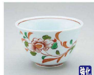
⑯ KY6-26 赤絵草花反干茶 [SMTT-H9] 納 画 記 17-1166-1601 ¥1,950 サイズ:φ92×H57 160cc 磁器製