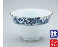
⑮ KY6-25 山水反干茶 [SMTT-H8] 納 画 記 17-1166-1501 ¥1,850 サイズ:φ92×H57 160cc 磁器製