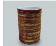
⑩ KY10-29 赤巻金渦長湯呑 [SMTU-29] 納 画 記 17-1166-1001 ¥3,300 サイズ:φ67×H102 220cc 磁器製