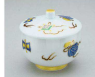
⑭ KY6-24 宝尽くし蓋付干茶 [SMTT-H7] 納 画 記 17-1166-1401 ¥4,750 サイズ:φ82×H83 180cc 磁器製