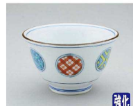
⑰ KY6-27 丸紋反干茶 [SMTT-H0] 納 画 記 17-1166-1701 ¥2,100 サイズ:φ92×H56 160cc 磁器製