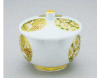
⑬ KY6-23 金彩丸紋蓋付干茶 [SMTT-H6] 納 画 記 17-1166-1301 ¥4,500 サイズ:φ82×H83 180cc 磁器製