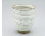
⑫ KY6-22 粉引長湯呑 [SMTT-H5] 納 画 記 17-1166-1201 ¥2,400 サイズ:φ73×H83 180cc 陶器製