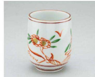
⑥ KY6-10 赤絵樽型湯呑 [SMTT-G3] 納 画 記 17-1166-0601 ¥3,060 サイズ:φ62×H82 180cc 磁器製