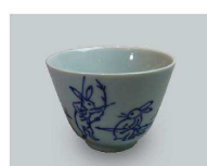
⑲ KY10-32 高山寺干茶 [SMTU-32] 納 画 記 17-1166-1901 ¥1,900 サイズ:φ89×H64 200cc 磁器製