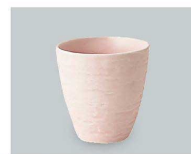
㉚ 桜華 湯呑 [SKDD-07] 納 画 記 17-1166-3001 ¥1,170 サイズ:φ74×H74 180cc 磁器製