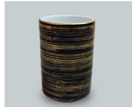
⑧ KY10-28 黒巻金渦長湯呑 [SMTU-28] 納 画 記 17-1166-0801 ¥3,300 サイズ:φ67×H102 220cc 磁器製