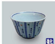
⑱ KY10-31 色入点十草干茶 [SMTU-31] 納 画 記 17-1166-1801 ¥2,350 サイズ:φ91×H58 190cc 磁器製