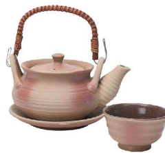
⑤ 火ダズキ風土瓶蒸し K25-26-65