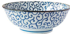
⑧ 丸型63ラーメン 和文様/唐草