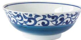
⑨ 丸型63ラーメン 丸唐草/青