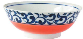
⑩ 丸型63ラーメン 丸唐草/赤