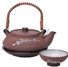
③ 松葉土瓶蒸し K25-27-65