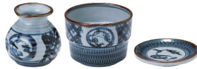
② 間取イナホ [SYTK-05]