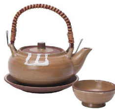
④ イラボ土瓶蒸し K25-20-65