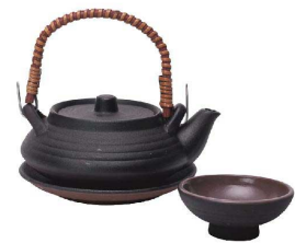
⑥ 黒土瓶蒸し K25-15-65