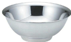
⑪ 18-8 メタル丼 [SMET-01] 6