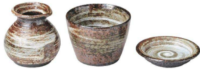
① 粉引刷毛 [SYTK-07]