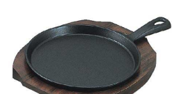
13 トキワ 鉄 ステーキ皿 315 柄付 [PSTC-14] ◇ B IH

鉄板 木台 kg 大 φ207×329×H52 241×204 2.0 17-1184-1301 ¥4,300 小 φ176×276×H46 212×175 1.4 17-1184-1302 ¥3,100