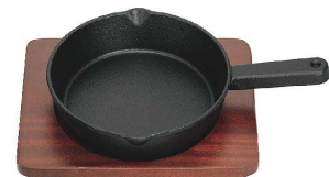
7 アサヒ 鉄 ステーキ皿 ミニコック [PSTD-15] ◇ B IH

17-1184-0701 ¥4,200 鉄板: φ160×H35 木台: 205×165 重量: 1.1kg