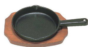
10 鉄 ステーキ皿 手付深丸型B [PSTB-48] ◇ B IH

鉄板 木台 kg 15cm φ155×H40 200×160 1.2 17-1184-1001 ¥5,000 17cm φ175×H45 225×180 1.6 17-1184-1002 ¥5,900