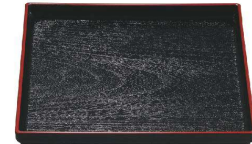
⑥ 正角木目盆 黒天朱SL (ノンスリップ加工) [QBON-39] W