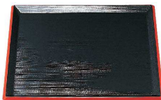
④ 利休角盆 黒天朱SL (ノンスリップ加工) [QBON-21] W