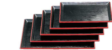
① 清流長手木目盆 黒天朱 [QBON-17] W