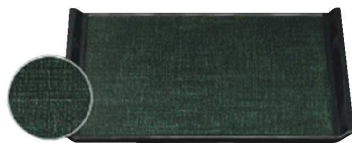
⑦ ウェーブ布目盆 グリーンカスリ黒淵SL (ノンスリップ加工) [QBON-41] W