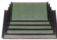
⑧ 宴盆 グリーン石目黒 (ノンスリップ加工) [QBON-08] W