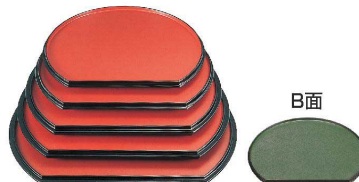
⑪ 新半月両面盆 朱乾漆/グリーン乾漆 [QBON-23] W