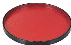
⑩ 丸盆 朱天黒SL (ノンスリップ加工) [QBON-38] W