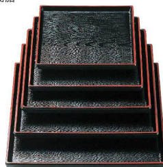
⑤ 正角木目盆 黒天朱 [QBON-22] W