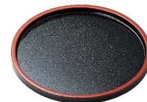
⑨ DX丸盆 黒天朱SL (ノンスリップ加工) [QBON-37] W