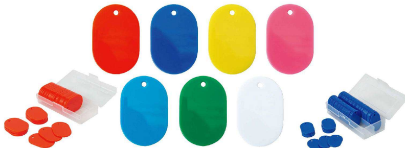
⑤ スチロール番号札 無地 大(50枚入) [QBGH-01] 目

●手で触れることの多い番号札に除菌・抗菌効果の高い銀イオン(Ag+)を配合しています。