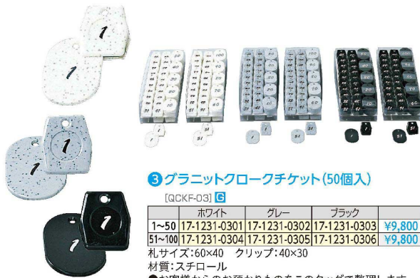
③ グラニットクロークチケット(50個入) [QCKF-03] 目