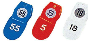
① クローク札 No.1(50個セット) [QCKF-01] 目