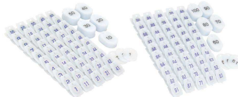
④ スチロールクロークチケットA型 抗菌Ag+ [QCKF-04] 目