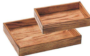
⑦ 木製アメニティ&多目的トレイ 焼板タイプ [TAMB-04] ㊄