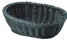
⑥ PPラタン マルチケース(オーバル) ブルーグリーン [DBSK-66] ㊄