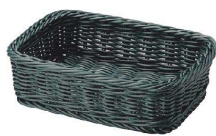
⑤ PPラタン マルチケース(角) ブルーグリーン [DBSK-65] ㊄