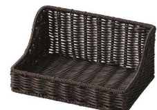
⑯ アメニティ&多目的ケース ダークブラウン [TAMB-11] ㊄