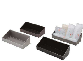
① アメニティBOX-3 [TAMB-01] ㊄