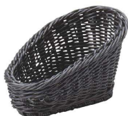
⑬ アメニティ&多目的ケース ブラック [TAMB-08] ㊄