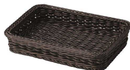
⑭ アメニティ&多目的ケース ダークブラウン [TAMB-09] ㊄