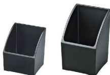
⑨ アメニティスタンド [TMCB-19] ㊄