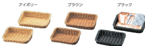
⑩ アメニティ&多目的トレイ 大 [TAMB-05] ㊄