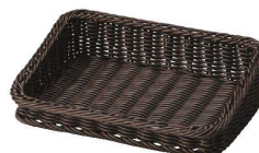
⑮ アメニティ&多目的トレイ ダークブラウン [TAMB-10] ㊄