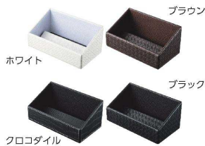
② アメニティケース TM-Z [TAMB-02] ㊄