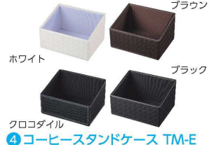
④ コーヒースタンドケース TM-E [TCSC-01] ㊄