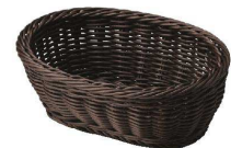
⑫ オーバル 多目的ケース ダークブラウン [TAMB-07] ㊄