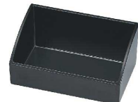
⑧ ドリップバック入れ M810EB [TMCB-18] ㊄