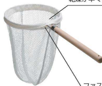
ファスナー式で網を簡単脱着。