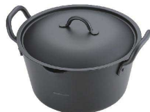
⑫ IH 鉄 たっぶり深型揚鍋

サイズ:φ231×H97 満水容量:1.6ℓ 底厚:1.6 重量:0.7kg 材質:本体/鉄(透明シリコン焼付塗装) 取手/鉄(クロームメッキ) ●機動性に優れた鉄製のミニシリーズです。