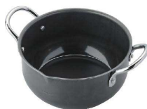
⑪ 鉄 ミニ揚鍋 16cm [AAGC-07] ▽ ▽ ▽

サイズ φ 18cm 253×100×H80 0.6 17-0208-1001 ¥12,000 20cm 273×200×H90 0.9 17-0208-1002 ¥12,500 ●熱が全体に行き渡り、からっと揚がります。