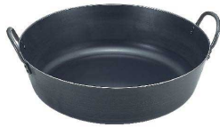
① KYS 鉄 揚鍋 [AAGC-03] △