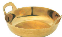
⑧ 真鍮 揚げ鍋 [AAGE-01] ▽

●錆防止のため、全体に黒炭加工が施してあります。 ご使用前に黒炭を洗い落として頂く必要があります。 ※鉄製のため赤サビが発生する場合があります。 対応方法は各製品の取扱説明書をご覧ください。 ※表面を研磨しておりますので現物は画像と異なります。