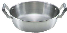
④ 18-10 ロイヤル 天ぷら鍋 XPD