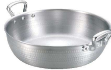
② アルミ 打出揚鍋 [AAGB-01] ▽