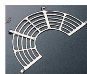
⑮ 自在アミ [ATEA-02]

サイズ 27cm用 17-0208-1401 ¥ 920 30cm用 17-0208-1402 ¥ 970 33cm用 17-0208-1403 ¥1,030 36cm用 17-0208-1404 ¥1,140 39cm用 17-0208-1405 ¥1,250 ※サイズにあった揚鍋をご使用ください。