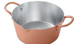
⑩ からっと銅のあげなべ [AAGD-02] ▽

天ぷら鍋 21cm [AEMP-08] ◇ ▽ ▽ 17-0208-0901 ¥11,500 サイズ:φ210×H80 容量:2.3ℓ 重量:0.87kg 材質:アルミクラッド三層鋼