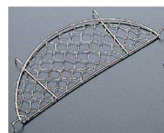
⑭ 18-8 手作り天ぷらアミ [ATEA-01]

17-0208-1301 ¥9,300 サイズ:300×300×H450 3面 ●ガスバーナーをすっぽりつつみ、油の飛び散りを防ぎます。