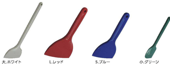
大、ホワイト L、レッド S、ブルー 小、グリーン