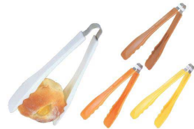
①サークルプレート tong GL-100