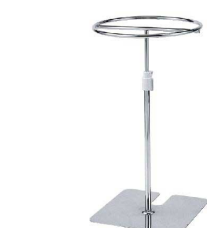
⑮18-0 ミニ tong スタンド GL-42 (クロームメッキ) [BTGX-04] △ E