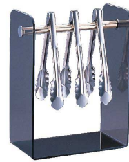
⑫アクリル tong スタンド [BTGX-09] △