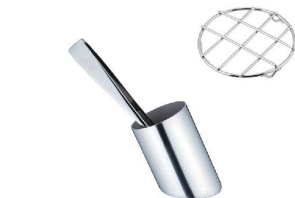
⑨18-8 ピサ マルチスタンド (目皿付) [BTGX-16] △ E