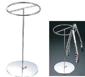
⑭18-8 丸型 tong スタンド [BTGX-03] △