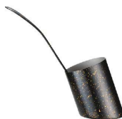
⑩18-8 ピサ マルチスタンド ブラック & ゴールド(目皿付) [BTGX-17] △ E