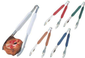
②ペーカリー tong GL-770