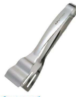
⑦UDパント tong [BTGD-30] △ G