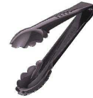
④ポリカーボ 万能 tong [BTGA-09] U