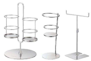
⑪tong スタンド [BTGX-20] △ E