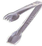
③ポリカーボ サラダ tong [BTGD-12] △ U