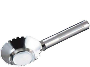
⑱ 18-8 うろこ取り 銀鱗