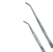
⑭ 18-0 先曲 ピンセット [BPIN-03] △