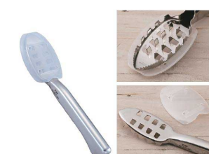
⑲ うろこ取り DH-3016