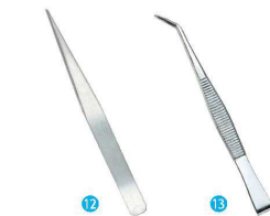
⑫ 先尖リピンセット QQ-504