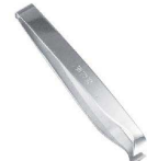
④ 18-0 板前用骨抜き 4寸