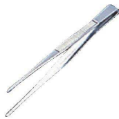
⑩ 18-0 ピンセット [BPIN-02] △