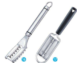
⑯ 18-8 うろこ取り