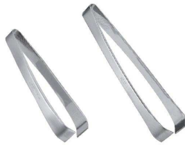
⑥ 18-8 仙武堂 丸骨抜