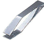
② 18-0 美粧 骨抜き 西型