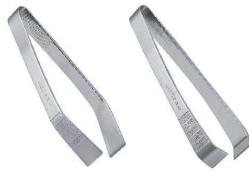
⑤ 18-0 仙武堂 滑り止め付骨抜