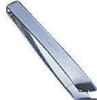
③ 18-0 美粧 柳刃骨抜き