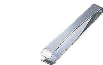
① 18-0 美粧 骨抜き 東型