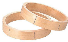
③ 桧中華セイロ台輪 [ASIR-47] △