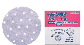
⑫ 旭化成 クワッパ― 穴明きセパレート紙(500枚入) [ASEP-02] △

●陶板焼やセイロ料理などに御使用下さい。 ●両面特殊加工で料理がくっつきません。 ●適度に蒸気を通し、油は通しません。 ●耐熱温度は250℃(20分)