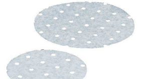
⑬ 業務用両面シリコンペーパー リンベシート 丸型 穴明 [ASIP-01]

穴直径：6mm(25mmピッチ) ●蒸気をしっかり通して、料理もキレイに仕上がります ●料理がくっつかず、サラツとはがれてキレイ