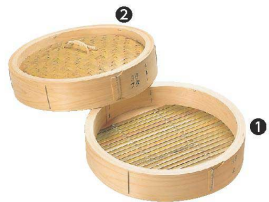
① 桧中華セイロ身 [ASIR-46] △