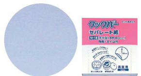
⑪ 旭化成 クワッパ― セパレート紙(500枚入) [ASEP-01] △