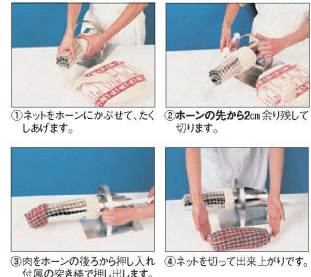
①ネットをホーンにかぶせて、たくしあげます。 ②ホーンの先が2cm余り残して切ります。