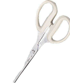
③ シルキー カニ専用バサミ KUS-210 [BKTV-11] △ 洗

17-0295-0301 ¥2,130 全長:210 刃渡り:40 材質:刃部/ステンレス刃物鋼 ハンドル/エラストマー樹脂 ●身をすみずみまで取り出せます。