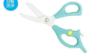
⑧ 携帯お食事鋏 麺・切って!! SUM-1300 [BKTV-51] 洗

17-0295-0701 ¥1,500 全長:155 刃渡り:40 耐熱温度:90°C 材質:刃部/ステンレス刃物鋼 ハンドル/ポリプロピレン樹脂 ●パネ付きでらくらく切れます。 ●分解して洗えるため、衛生的です。