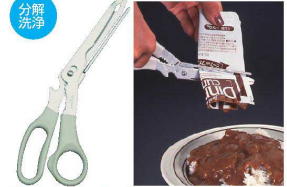
⑯ キッチンシボレー TK-88

17-0295-1501 ¥1,700 サイズ:全長360×絞り部210 材質:ステンレススチール(フッ素コーティング)、 ポリプロピレン(耐熱80°C) ●レトルトパックなどの具を無駄なく絞り出 すことができます。