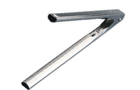
⑰ 18-0 レトルトトング [BTGD-61] ◇

[BSEN-07] 洗 17-0295-1601 ¥1,200 全長:225 ●切る、栓抜、銀杏割り、レトルト食品の絞り 込みなど多岐に渡って使えます。 ●分解洗浄可能