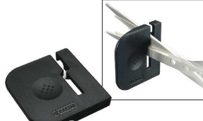
⑪ 京セラ HT-NBK ハサミ研ぎ器 [BHTG-01] 洗

17-0295-1001 ¥2,660 全長:170 刃渡り:65 材質:刃/ステンレス刃物鋼1K6 ハンドル/アクリル樹脂 ●刃部は冷間鍛造により、ねばりとこしを増し、 より「厚物」を切れる切れ味に仕上がっています。