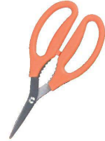
④ 細刃 カニバサミ オレンジ C-3819 [BKTV-30] △ 洗

17-0295-0301 ¥2,130 全長:210 刃渡り:40 材質:刃部/ステンレス刃物鋼 ハンドル/エラストマー樹脂 ●身をすみずみまで取り出せます。