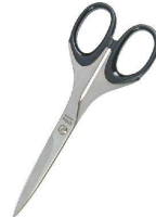
⑩ シルキー オフィスシザー NBS-170 [BKTV-44] 洗

17-0295-0901 ¥2,200 全長:196 刃渡り:65 材質:刃/ステンレス トング部/ナイロン ハンドル/エラストマー樹脂 ●食材のカットサイズの目安が分かる目盛り付き。 ●食材を逃がさずしっかり切れるカーブ刃仕様。 ●分解洗浄が可能で衛生的です。