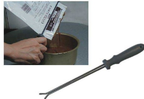
⑮ 絞り具 TG-1405 [BSBK-01]

17-0295-1401 ¥400 全長:115 材質:ABS樹脂 ●お菓子、冷凍食品、レトルト食品などの袋類 をハサミを使わず簡単に開封できます。