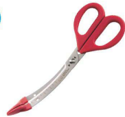
⑨ トング付きキッチンハサミ DH-2064 [BKTV-63] 洗

17-0295-0901 ¥2,200 全長:196 刃渡り:65 材質:刃/ステンレス トング部/ナイロン ハンドル/エラストマー樹脂 ●食材のカットサイズの目安が分かる目盛り付き。 ●食材を逃がさずしっかり切れるカーブ刃仕様。 ●分解洗浄が可能で衛生的です。