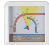
8 食中毒防止用 温度計 SN-900 [BOSD-13] 目

17-0316-0801 ¥4,500 サイズ:235×235×H47 測定範囲:温度-10~+40°C(1目盛2°C) 湿度0~100%(1目盛5%)