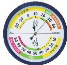
5 温度計 F-4L 生活管理 [BOSD-08] 目

17-0316-0501 ¥3,830 サイズ:φ156×30 測定範囲:温度-20~+40°C(1目盛2°C) 湿度10~90%(1目盛5%)