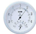
4 温度計 TT-492 ホワイト [BOSD-19] 目

17-0316-0401 ¥2,000 サイズ:φ140×H30 測定範囲:温度-20~+40°C(1目盛1°C) 湿度20~90%(1目盛2%)