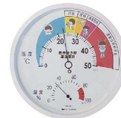
子どもにも分かりやすいイラスト入り表示