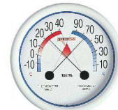
7 温度計 5488 ホワイト (食中毒注意ゾーン付) [BOSD-21] 目

●食中毒表示をゾーン分けし見やすく表示。 ●屋内快適環境づくり省エネ・安全対策に。