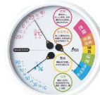
10 温度計 F-3LII 熱中症注意 70505 [BOSD-23] 目

●一目でわかる大型パネル採用で、誰でも簡単に判断基準を得られます。 ●アクリル製のフロントレンズなので、誤って落下させてもガラスのような危険がありません。 ●裏面は金網でガードされているので、虫の侵入を防ぎます。