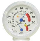
6 厨房用温度計 SN-909 [BOSD-33] 目

17-0316-0601 ¥2,700 サイズ:約φ136×31(スタンドは除く) 測定範囲:温度/-30~+50°C 湿度/0~100%rh 測定精度:温度/±2°C(-10~+40°C) 湿度/±5%rh(35~85%rh)