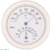
1 温度計 TT-513-WH [BOSD-01] 目

17-0316-0101 ¥2,000 サイズ:φ182×H32 測定範囲:温度-20~+40°C(1目盛2°C) 湿度10~90%(1目盛5%)