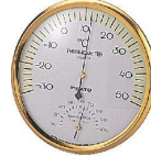
3 温度計 ハーモニー 3966 [BOSD-02] 目

17-0316-0301 ¥3,900 サイズ:φ150×H32 測定範囲:温度-30~+50°C(1目盛2°C) 湿度20~100%(1目盛5%)