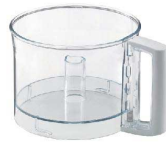
2 ボウル [EPPA-13] Ⅱ

●ボウルとボウルカバーがセットになっています。 ※スチール刃とインナーボウルは別売りです。