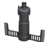
8 エッグビーター [EPPA-52] Ⅱ