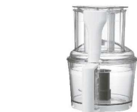
1 フレアセット [EPPA-57] Ⅱ