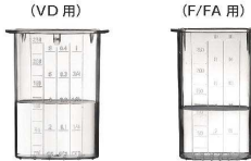
5 押し棒 [EPPA-29] Ⅱ