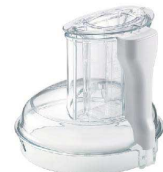
4 ボウルカバー [EPPA-16] Ⅱ