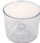
3 インナーボウル [EPPA-14] Ⅱ