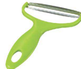
③ キャベツピーラー

(スライス&千切りセット) DH-3301 [BPIR-54] ◇ E 17-0338-0201 ¥3,000 サイズ:幅110×全長210 ●アタッチメントの交換によりスライス、千切りに対応。 ●収納用安全カバー付。