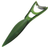
⑨ アスパラガスピーラー

F20739 [BPIR-20] ◇ E 17-0338-0901 ¥1,600 サイズ:幅42×全長170 材質:刃部/ステンレス 柄部/ポリカーボネイト、合成ゴム ●刃のカーブがアスパラに沿いきれいに剥けるピーラーです。