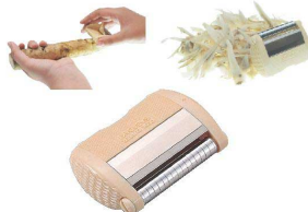
⑤ ささがき [ESLC-06] ◇ S

17-0338-0501 ¥1,980 サイズ:65×45×H20 厚さ調節:0.1~2mm 付属品:替刃6枚 ●ささがきが楽にできます。