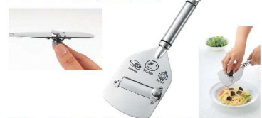
⑭ シェフランドトリュフスライサー

[BPIR-48] ◇ U 17-0338-1401 ¥3,700 サイズ:250×90 重量:138g 材質:18-8ステンレス、ABS樹脂 ●ネジを回してスライスの厚さを調整することができるので、チーズや玉ねぎなど幅広い用途で使用可能です。