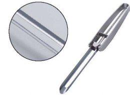
⑧ ロングピーラー+プラス

[BPIR-33] ◇ 17-0338-0701 ¥680 サイズ:頭部50×全長160 ●右利きでも左利きでも使えます。 ●キャップ付