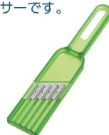
⑪ きゅうりウェーブスライサー

[ESLC-58] 17-0338-1101 ¥1,000 サイズ:215×41×H13 材質:本体/スチロール樹脂 刃/ステンレススチール 耐熱温度:70℃ 耐冷温度:-30℃