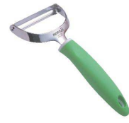
④ キャベツピーラー CBP-01

FCP-01 [BPIR-53] ◇ E 17-0338-0301 ¥750 サイズ:幅120×全長170