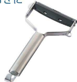
② 関孫六 ワイドピーラー

(スライス&千切りセット) DH-3301 [BPIR-54] ◇ E 17-0338-0201 ¥3,000 サイズ:幅110×全長210 ●アタッチメントの交換によりスライス、千切りに対応。 ●収納用安全カバー付。