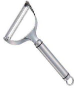
① 18-8 ジャンボピーラー

[BPIR-29] ◇ U 17-0338-0101 ¥1,900 サイズ:幅90×全長220