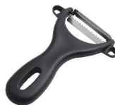
⑥ きんぴらピーラー AL-256

17-0338-0501 ¥1,980 サイズ:65×45×H20 厚さ調節:0.1~2mm 付属品:替刃6枚 ●ささがきが楽にできます。