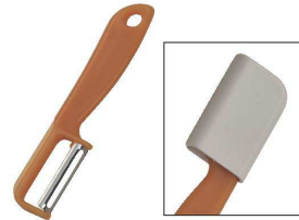
⑦ ニューささがきピーラー

[BPLA-02] ◇ E 17-0338-0601 ¥850 サイズ:幅83×全長126 材質:刃部/ステンレス刃物鋼 柄部/ポリプロピレン(耐熱温度90℃) ●にんじん・大根の千切りにも。