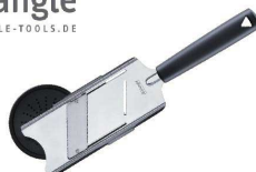
⑬ トライアングルトリュフスライサー

[BTRI-28] ◇ E 17-0338-1301 ¥8,800 サイズ:290×80×H34 用途:薄くスライス/トリュフ、にんにく、唐辛子など ミディアムスライス/ ポテト、にんじん、キュウリ、ズッキーニなど ●厚さ調整ネジで簡単にスライス厚を調整できます。 ●安全ホルダー付きで、最後まで安全にスライスできます。