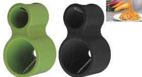
⑩ スパイラルカッター

F20739 [BPIR-20] ◇ E 17-0338-0901 ¥1,600 サイズ:幅42×全長170 材質:刃部/ステンレス 柄部/ポリカーボネイト、合成ゴム ●刃のカーブがアスパラに沿いきれいに剥けるピーラーです。